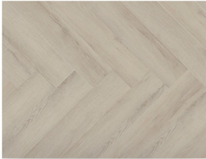
Roble Puerto Azul